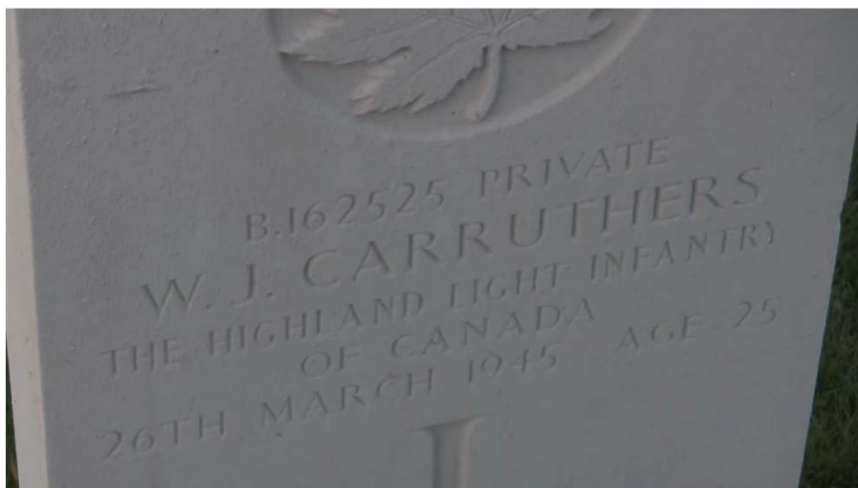
STUDENT FINDS FAMILY GRAVE AT WW2 CEMETARY IN HOLLAND

Student vindt familie op de oorlogsbegraafplaats in Holland: Verslag Stille Tocht op 4 mei 2010, van het gemeentehuis naar de Canadese oorlogsbegraafplaats, tijdens de 65 e herdenking van de bevrijding: https://youtu.be/mQ-nRvk9mvI